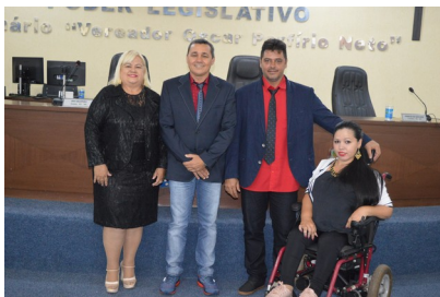
Mesa Diretora eleita

A nova Mesa Diretora do Legislativo assume automaticamente em 1º de janeiro de 2019.