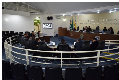
Vereadores em Sessão Ordinária

IV- R$ 16.700,00 para o Departamento de Assistência Social – Fundo Social de Solidariedade para investimentos. O vereador sugeriu a aplicação do recurso na construção de unidade expositora de produtos das Padarias Artesanais, vinculados ao Fundos Social de Solidariedade no andar térreo do Centro de Atendimento ao Cidadão, localizado no antigo Palace Hotel, visando a comercialização dos produtos e a geração de emprego e renda aos participantes.