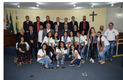
Vereadores com equipe Unimed

Estiveram presentes na Sessão para prestigiar a moção, a diretoria da Unimed, assim com as atletas paraguaçuenses campeãs do basquete, que exibiram com orgulho suas medalhas e troféus.