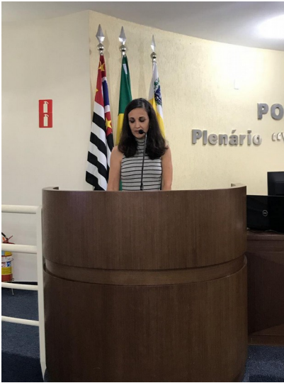
Iraciana na Tribuna Livre